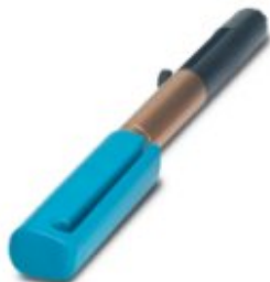
Инструмент для демонтажа кабельных наконечников СК-1,6-...

Обратите внимание на то, что приведенные здесь данные взяты из online-каталога. Полная информация и данные содержатся в документации пользователя. Действуют Общие условия использования для информации, загруженной из интернета. ( http://phoenixcontact.ru/download )