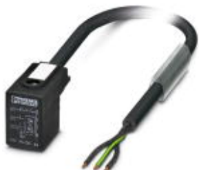
Кабель для датчика / исполнительного элемента, 3-полюсн.

Обратите внимание на то, что приведенные здесь данные взяты из online-каталога. Полная информация и данные содержатся в документации пользователя. Действуют Общие условия использования для информации, загруженной из интернета. ( http://phoenixcontact.ru/download )