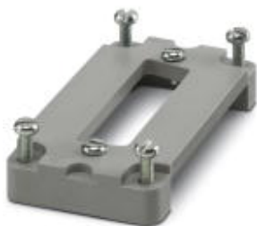
Соединительная плата D-SUB, для подсоединения одного штекера D-SUB, количество полюсов 25, серия корпусов HC-B 10...

Обратите внимание на то, что приведенные здесь данные взяты из online-каталога. Полная информация и данные содержатся в документации пользователя. Действуют Общие условия использования для информации, загруженной из интернета. ( http://phoenixcontact.ru/download )