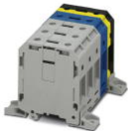
для прямого монтажа

Обратите внимание на то, что приведенные здесь данные взяты из online-каталога. Полная информация и данные содержатся в документации пользователя. Действуют Общие условия использования для информации, загруженной из интернета. ( http://phoenixcontact.ru/download )