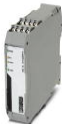
Modbus/RTU к преобразователю протоколов PROFIBUS PA

Обратите внимание на то, что приведенные здесь данные взяты из online-каталога. Полная информация и данные содержатся в документации пользователя. Действуют Общие условия использования для информации, загруженной из интернета. ( http://phoenixcontact.ru/download )