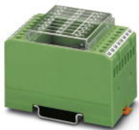
Диодный модуль, 8 диодов, с общим анодом, тип диодов 1N 5408

Обратите внимание на то, что приведенные здесь данные взяты из online-каталога. Полная информация и данные содержатся в документации пользователя. Действуют Общие условия использования для информации, загруженной из интернета. ( http://phoenixcontact.ru/download )