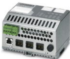
Коммутатор Ethernet, один порт RJ45 и три порта POF SC-RJ для PROFINET RT/IRT, возможность установки на монтажную рейку

Обратите внимание на то, что приведенные здесь данные взяты из online-каталога. Полная информация и данные содержатся в документации пользователя. Действуют Общие условия использования для информации, загруженной из интернета. ( http://phoenixcontact.ru/download )