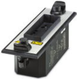
Тестовый адаптер CHECKMASTER 2 для серии FLT-SEC-H.

Обратите внимание на то, что приведенные здесь данные взяты из online-каталога. Полная информация и данные содержатся в документации пользователя. Действуют Общие условия использования для информации, загруженной из интернета. ( http://phoenixcontact.ru/download )