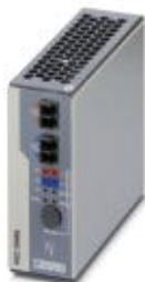
Модуль резервирования Ethernet для резервных сетей с протоколом резервирования PRP.

Обратите внимание на то, что приведенные здесь данные взяты из online-каталога. Полная информация и данные содержатся в документации пользователя. Действуют Общие условия использования для информации, загруженной из интернета. ( http://phoenixcontact.ru/download )