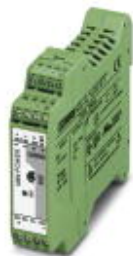
Преобразователь постоянного тока MINI для несущей рейки, вход: 1-фазный, выход: 24 В DC/1 А

Обратите внимание на то, что приведенные здесь данные взяты из online-каталога. Полная информация и данные содержатся в документации пользователя. Действуют Общие условия использования для информации, загруженной из интернета. ( http://phoenixcontact.ru/download )