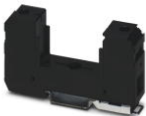
Базовый элемент для разрядников типа 1/2 серии VALVETRAV MS T1/T2. Исполнение: 1-канальный

Обратите внимание на то, что приведенные здесь данные взяты из online-каталога. Полная информация и данные содержатся в документации пользователя. Действуют Общие условия использования для информации, загруженной из интернета. ( http://phoenixcontact.ru/download )