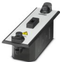
Тестовый адаптер CHECKMASTER 2 для серии CTM

Обратите внимание на то, что приведенные здесь данные взяты из online-каталога. Полная информация и данные содержатся в документации пользователя. Действуют Общие условия использования для информации, загруженной из интернета. ( http://phoenixcontact.ru/download )