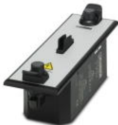
Тестовый адаптер CHECKMASTER 2 для серии TTC.

Обратите внимание на то, что приведенные здесь данные взяты из online-каталога. Полная информация и данные содержатся в документации пользователя. Действуют Общие условия использования для информации, загруженной из интернета. ( http://phoenixcontact.ru/download )