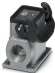
Приборный корпус с одной защелкой, высота 74 мм, без резьбового соединения, 1x Pg21

Обратите внимание на то, что приведенные здесь данные взяты из online-каталога. Полная информация и данные содержатся в документации пользователя. Действуют Общие условия использования для информации, загруженной из интернета. ( http://phoenixcontact.ru/download )