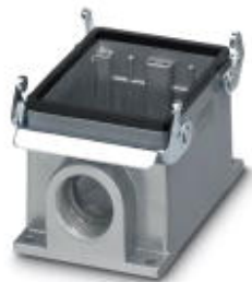
Приборный корпус, с двумя защелками, высота 72 мм, с патрубками, 2x Pg29

Обратите внимание на то, что приведенные здесь данные взяты из online-каталога. Полная информация и данные содержатся в документации пользователя. Действуют Общие условия использования для информации, загруженной из интернета. ( http://phoenixcontact.ru/download )