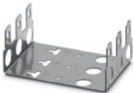
На рисунке показана модель СТ 10-MB/ 3

Монтажный хомут для установки 10 колодок с заземляющим проводником или с размыкателями. Исполнение: 10 сдвоенных проводников, размер: А 104,5 мм, размер В 245,5 мм