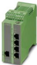
Управляемый коммутатор Ethernet Lean с пятью портами RJ45 на 10/100 Мбит/с

Обратите внимание на то, что приведенные здесь данные взяты из online-каталога. Полная информация и данные содержатся в документации пользователя. Действуют Общие условия использования для информации, загруженной из интернета. ( http://phoenixcontact.ru/download )