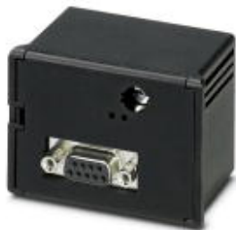
Коммуникационный модуль PROFIBUS DP (12 Мбит/с) для EEM-MA600

Обратите внимание на то, что приведенные здесь данные взяты из online-каталога. Полная информация и данные содержатся в документации пользователя. Действуют Общие условия использования для информации, загруженной из интернета. ( http://phoenixcontact.ru/download )