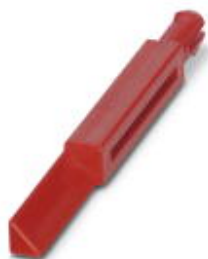
Механический ключ (профиль) для серии Q12

Обратите внимание на то, что приведенные здесь данные взяты из online-каталога. Полная информация и данные содержатся в документации пользователя. Действуют Общие условия использования для информации, загруженной из интернета. ( http://phoenixcontact.ru/download )