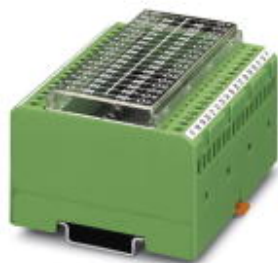
Диодный модуль, с общим катодом, 32 диода типа 1N 4007

Обратите внимание на то, что приведенные здесь данные взяты из online-каталога. Полная информация и данные содержатся в документации пользователя. Действуют Общие условия использования для информации, загруженной из интернета. ( http://phoenixcontact.ru/download )