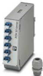
Соединительная коробка для несущей рейки, полностью готова к сращиванию, для 6 LC-Duplex (OS2)

Обратите внимание на то, что приведенные здесь данные взяты из online-каталога. Полная информация и данные содержатся в документации пользователя. Действуют Общие условия использования для информации, загруженной из интернета. ( http://phoenixcontact.ru/download )