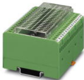
Диодный модуль, 32 диода, с общим анодом, тип диодов 1N 4007

Обратите внимание на то, что приведенные здесь данные взяты из online-каталога. Полная информация и данные содержатся в документации пользователя. Действуют Общие условия использования для информации, загруженной из интернета. ( http://phoenixcontact.ru/download )