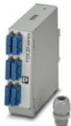
Кабельная коробка для несущей рейки, без шлейфов, для 6 SC-Duplex

Обратите внимание на то, что приведенные здесь данные взяты из online-каталога. Полная информация и данные содержатся в документации пользователя. Действуют Общие условия использования для информации, загруженной из интернета. ( http://phoenixcontact.ru/download )