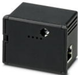
Коммуникационный модуль Ethernet для EEM-MA600 с интегрированным веб-сервером

Обратите внимание на то, что приведенные здесь данные взяты из online-каталога. Полная информация и данные содержатся в документации пользователя. Действуют Общие условия использования для информации, загруженной из интернета. ( http://phoenixcontact.ru/download )