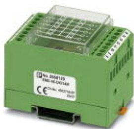
Диодный модуль, 14 диодов, с общим анодом, тип диодов 1N 4007

Обратите внимание на то, что приведенные здесь данные взяты из online-каталога. Полная информация и данные содержатся в документации пользователя. Действуют Общие условия использования для информации, загруженной из интернета. ( http://phoenixcontact.ru/download )