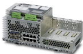
Модульный коммутатор Gigabit со встроенной функцией маршрутизации

Обратите внимание на то, что приведенные здесь данные взяты из online-каталога. Полная информация и данные содержатся в документации пользователя. Действуют Общие условия использования для информации, загруженной из интернета. ( http://phoenixcontact.ru/download )