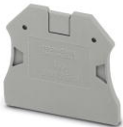
Концевая крышка, длина: 47 мм, ширина: 2,2 мм, высота: 39,8 мм, цвет: серый

Обратите внимание на то, что приведенные здесь данные взяты из online-каталога. Полная информация и данные содержатся в документации пользователя. Действуют Общие условия использования для информации, загруженной из интернета. ( http://phoenixcontact.ru/download )